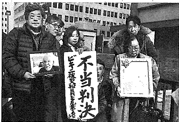
控訴審判決後に「不当判決」と書かれた紙を掲げる支援者。亡くなった元船員の写真を手にした遺族らは悔しさをにじませた。高松高裁前で2019年12月12日