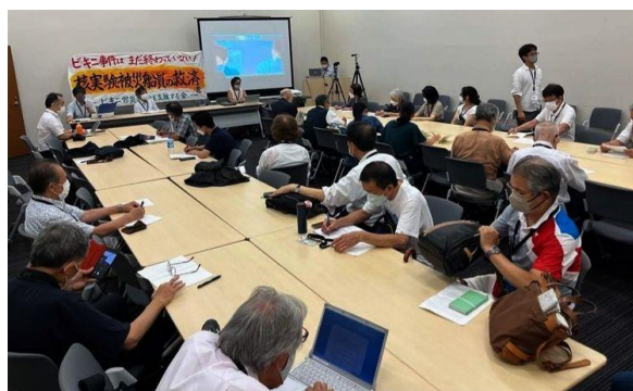
2022. 7. 26 東京地裁口頭弁論後の報告集会

右の QR コードから、裁判の動きなどを、 Facebook ページでご覧いただけます。