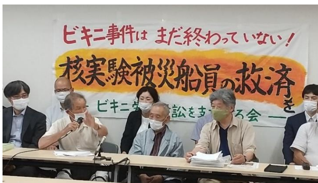
2022. 6. 17 高知地裁証人尋問後の記者会見